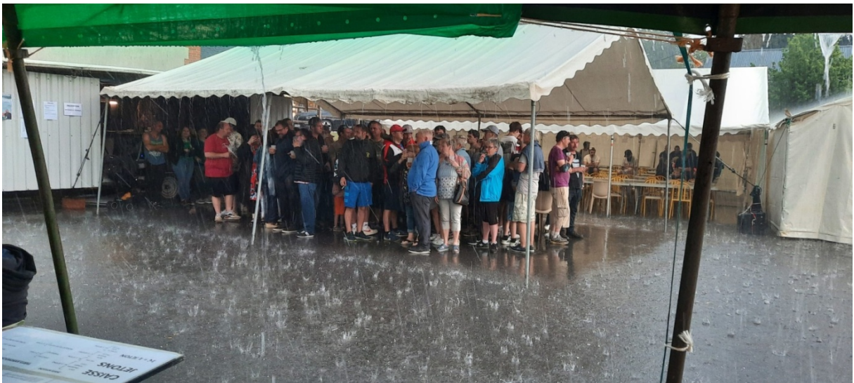
La pluie a attendu la fin du concours de pétanque