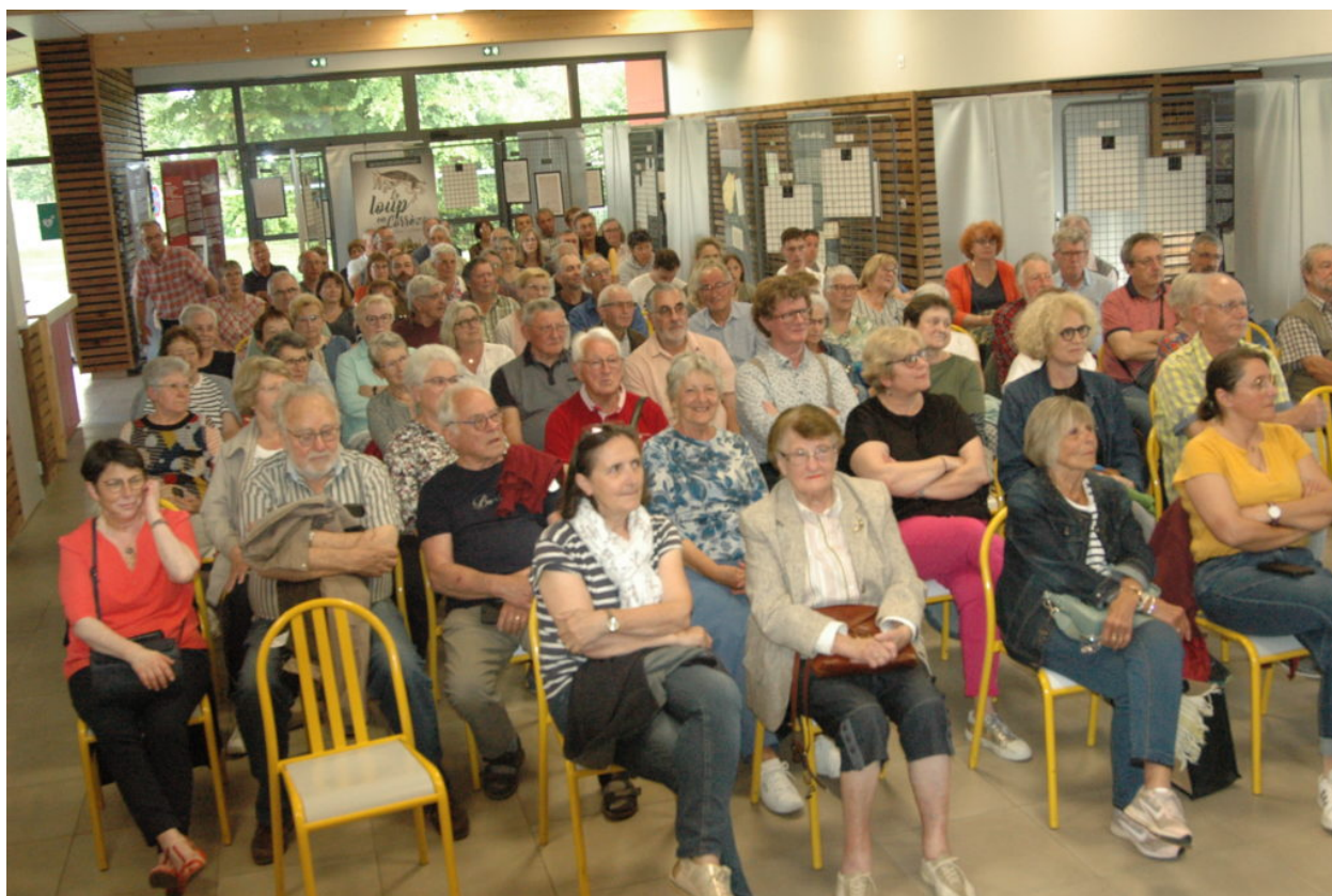
Le public était au rendez-vous.

La soirée s'est ensuite terminée dans la plus grande convivialité par un verre de l'amitié.