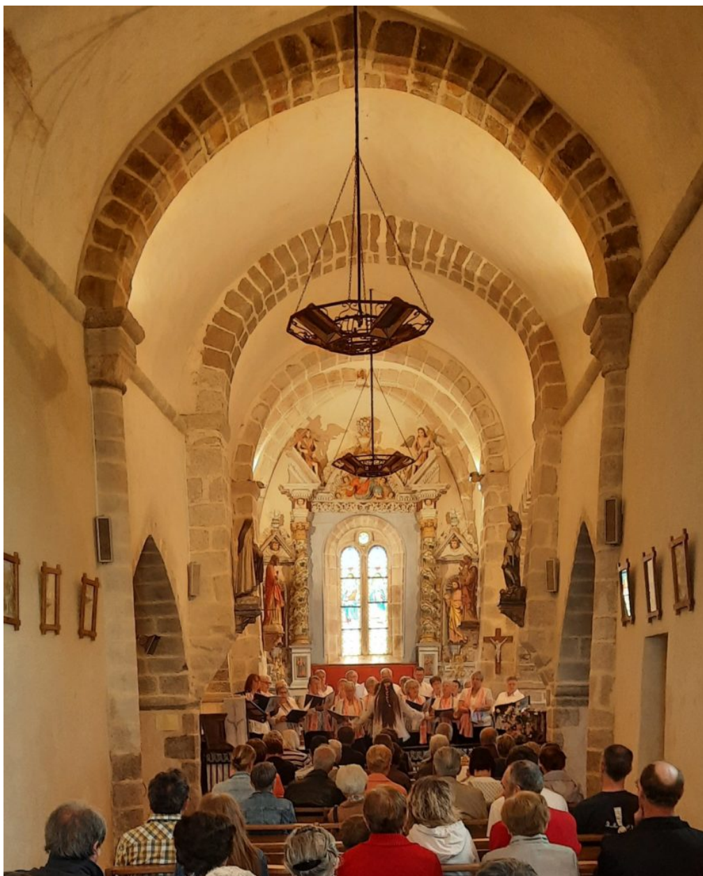
Concert des Couacs mélodieux en clôture de la messe.