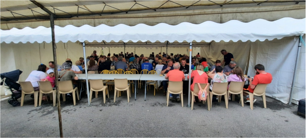
Repas du dimanche midi sous le soleil.