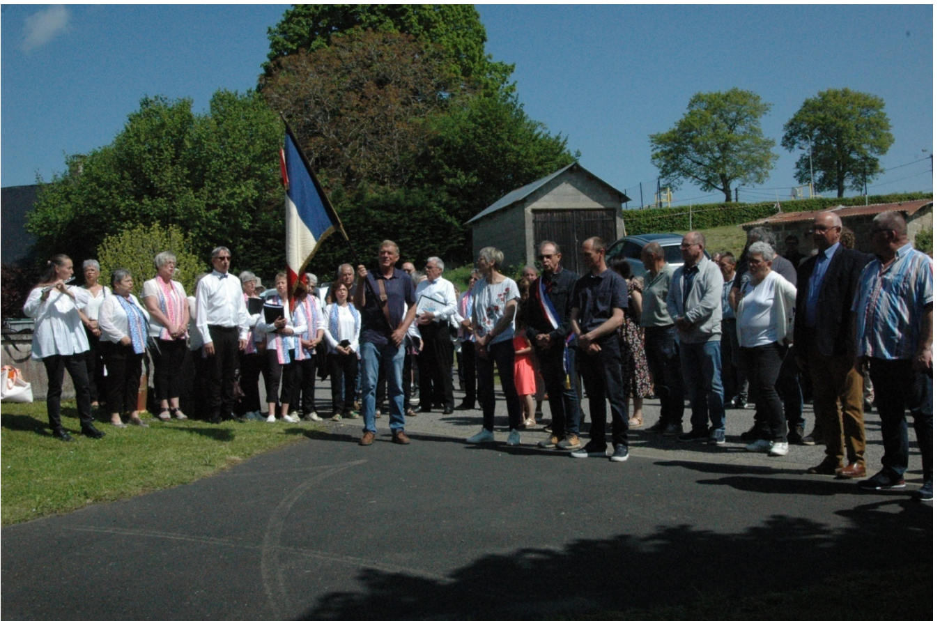
Dépôt de gerbe au monument aux morts