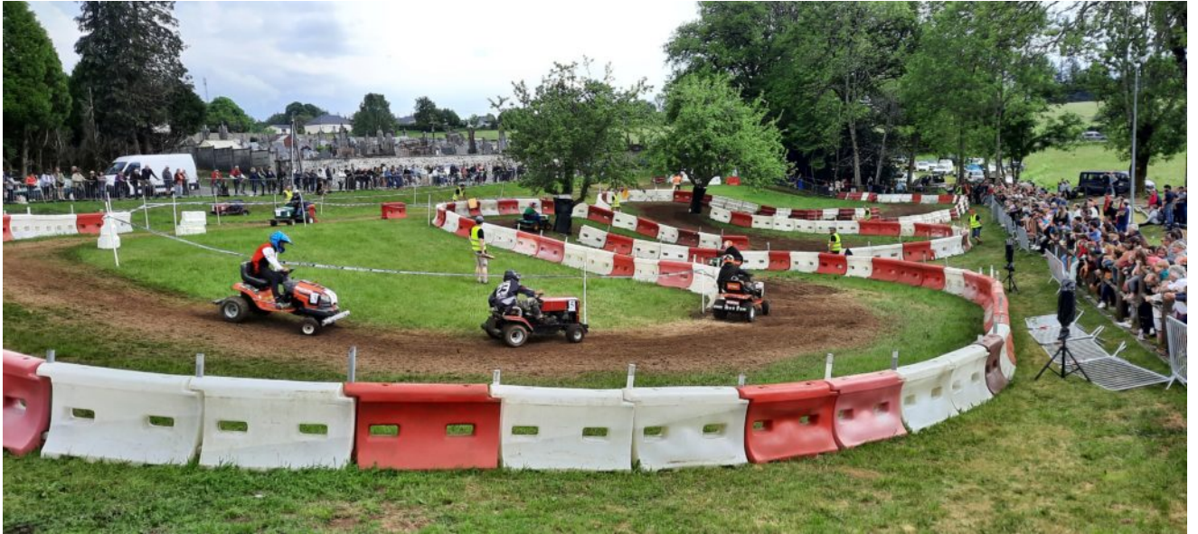
Traditionnelle démonstration des auto-portées

Cette année encore le public était nombreux pour assister aux différentes animations organisées durant le Week-end de la Pentecôte. Concours de pétanque, démonstration des auto-portées, laser game, balade en poney, concours de pêche, repas samedi soir et dimanche midi, telles étaient les nombreuses activités proposées par le comité des fêtes d'Aix.